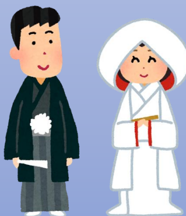
介護者が冠婚葬祭に出席