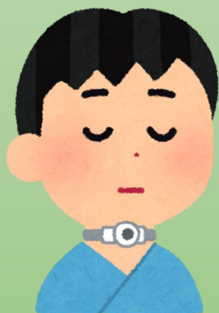
医療管理の多い方

医療保険で常時医療管理が必要な方を介護されている ご家族様が小休止(レスパイト)をとる短期入院