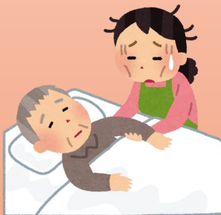
介護にお疲れの方